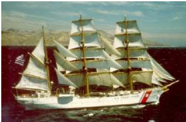
Abb. 33: Das Segelschulschiff „Eagle“, ein Schwesterschiff der Gorch Fock , 1936 bei Blohm & Voss in Hamburg gebaut, wurde 1946 von den Amerikanern als Reparation konfisziert dient es auch heute noch der amerikanischen Coast Guard. Das Herumsegeln mit konfisziertem Eigentum ist typisch für die USA.

Um die wirtschaftliche und finanzielle Situation Deutschlands heute zu verstehen, muss man zur Situation Deutschlands am Ende des Zweiten Weltkrieges zurückkehren. Die USA sahen Deutschland damals als einen Konkurrenten auf dem Weltmarkt , auf den man aufpassen muss, damit er nicht technologisch überholt oder zu viele Ressourcen verbraucht. Deutschland interessierte die USA in erster Linie als Militärstützpunkt, als Geldlieferant , als Risikoversicherer und als Workshop für bestimmte Produkte.